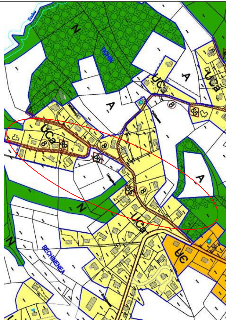
PLU PLANCHE NORD